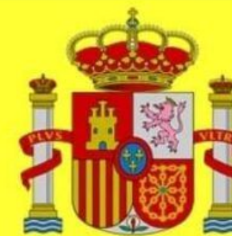
COAT OF ARMS